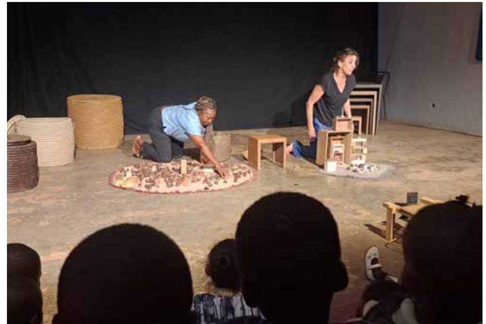
Une représentation de Yaaba dans une école au Burkina Faso